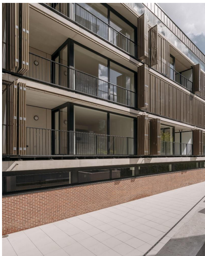
10 – Façade arrière