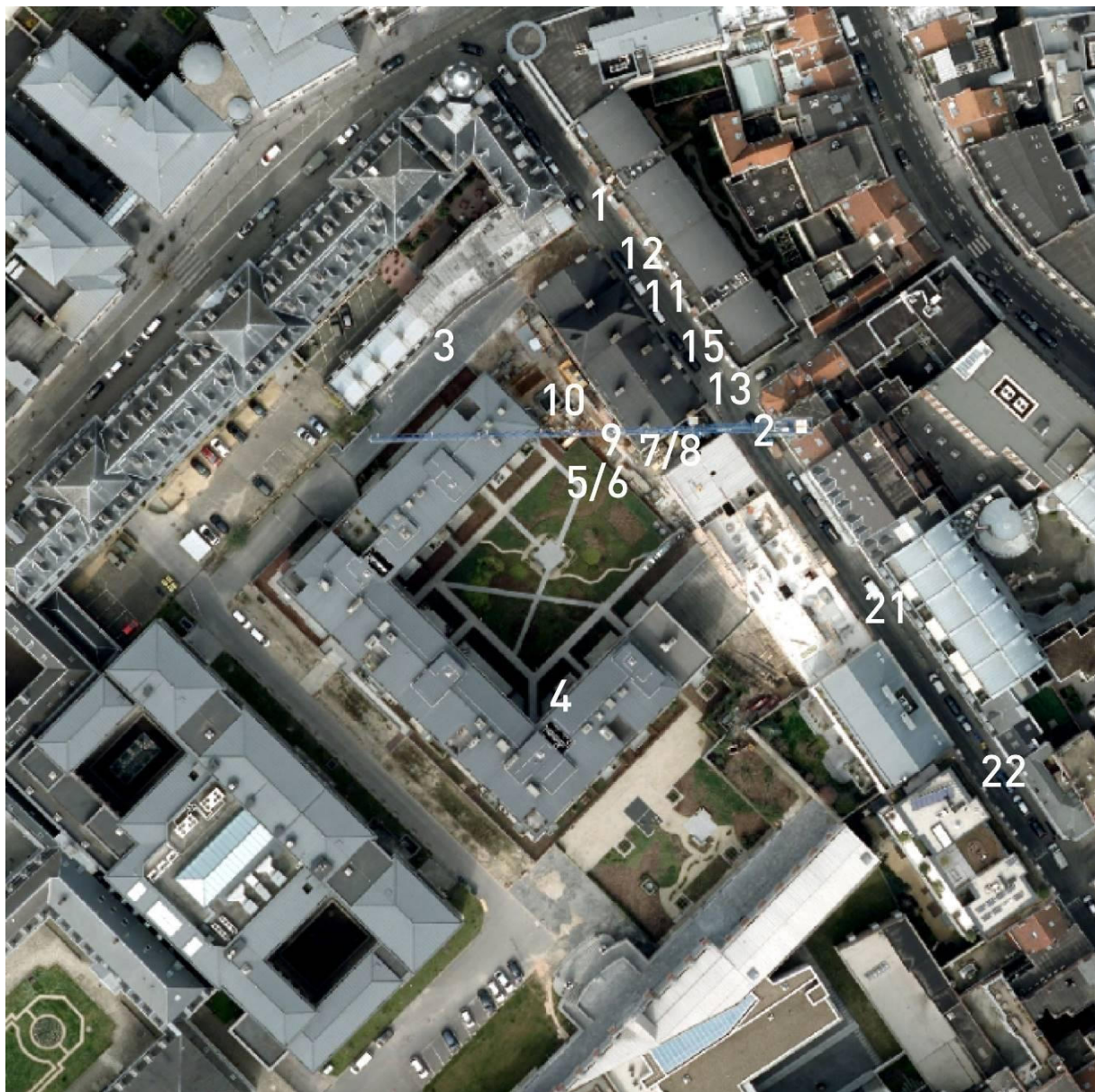
Implantation des photos

DEMANDE DE PERMIS D'URBANISME REPORTAGE PHOTOGRAPHIQUE